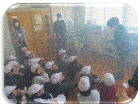
教室の中は真っ暗で、テーブルがかすかに見えます。