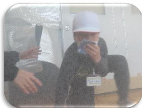
一人ずつ全員が体験しました。