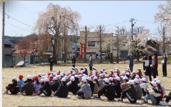
校庭に避難する子ども達