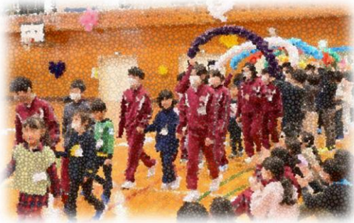
六年と一緒に入場