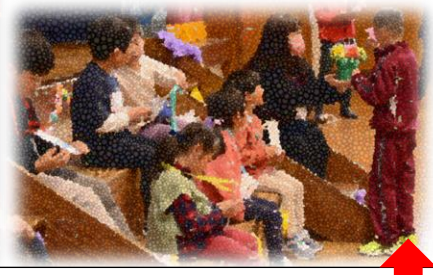
2年生からのプレゼント「あさがおの種とエール」