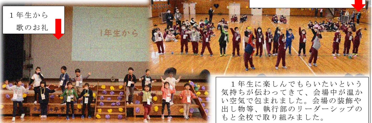
1年生から歌のお礼

1年生に楽しんでもらいたいという気持ちが伝わってきて、会場中が温かい空気で包まれました。会場の装飾や出し物等、執行部のリーダーシップのもと全校で取り組みました。