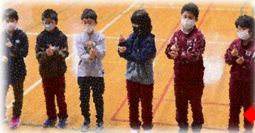
四年生の終わりの言葉（歌と手話）