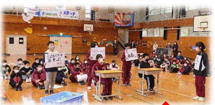
5・6年生の歓迎の出し物