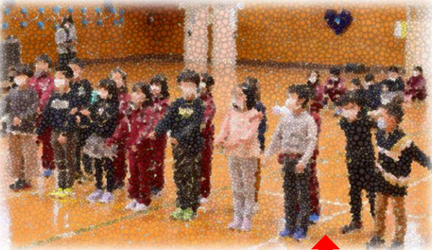
3年生のはじめの言葉