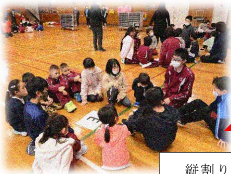
縦割り班レク「クイズ」