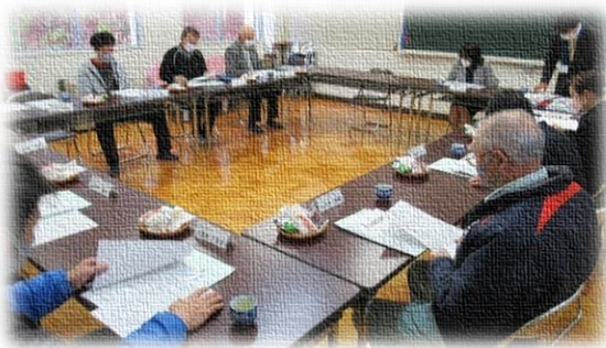
令和5年度 大野小学校 学校運営協議会 委員

たくさんのご意見等を頂戴しました。これからの学校運営に生かしていきます。今年度もよろしくお願いたします。