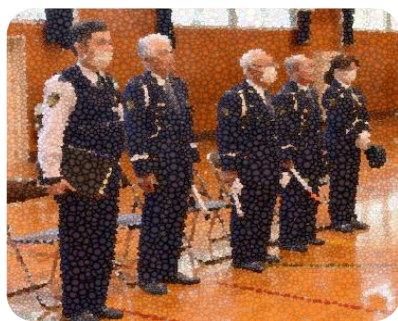
工藤所長さん、交通指導員の皆さんです。