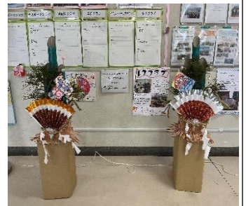
↑ 図書ボランティア「こびとのくつ屋さん」が作製して下さった「門松」です。